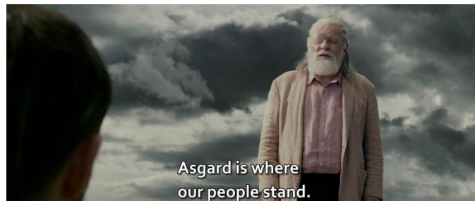
Gambar 6 Nasehat dari Odin kepada Thor tentang bangsanya.

Peluang Thor menjadi raja sangatlah besar. Dengan sifat dan kepribadian Thor, ia mampu menunjukkan kepada semua orang bahwa dia layak menjadi seorang pemimpin. Odin pun memberikan dia sebuah petunjuk untuk mengembalikan citra dirinya sebagai seorang pemimpin. Ketika akhirnya Asgard terancam akan musnah, Odin justru menasehati Thor bahwa sesungguhnya Asgard bukanlah sekedar sebuah nama tempat tapi Asgard merupakan sebuah tempat dimana rakyat menjalani kehidupannya. Ketika sebuah Negara hancur bukan berarti hancur pula orang-orangnya. Thor sebagai seorang pemimpin memiliki kesempatan untuk kembali mengangkat citra orang-orang Asgard dan mewujudkan kembali mimpi mereka sebagai orang Asgard . Hal ini terlihat dari potongan adegan beserta kutipan dialog berikut ini.