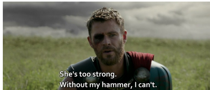
Gambar 5 Thor merasa telah kalah dan ingin menyerah.

THOR: She's too strong. Without my hammer, I can't. (TR, 01:47:59,070 - 01:48:02,080)