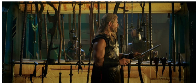
Gambar 4 Thor ketika memilih senjata sebelum bertarung di Sakaar.

Dibalik ketangguhan Thor, ia juga memiliki kelemahan yang diperlihatkan di dalam film. Ia begitu tergantung dengan senjatanya, palu Mjolnir . Ia merasa bahwa sumber kekuatan dia ada di palu tersebut. Ketika Hela menghancurkan palunya, Thor merasa dirinya begitu lemah. Hal ini sangat jelas terlihat ketika Thor terdampar di Sakaar, ia terpaksa mengikuti kontes bertarung ketika memilih senjata, ia kembali menunjukkan ketika percaya diriannya dengan berharap dia masih memiliki palu tersebut. Hal ini bisa terlihat dari potongan adegan berikut beserta kutipan dialognya.