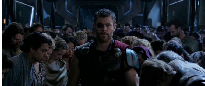
Gambar 3 Thor dihadapan para rakyat Asgardian .

Karena itu pulalah, rakyat Asgard menganggap dirinya sebagai raja. Ketika Hela bersusah payah untuk membuat mereka tunduk dan menghormatinya, hal itu berbanding terbalik ketika Thor bertemu dengan mereka. Mereka justru tunduk dengan sendirinya. Hal ini bisa terlihat dari potongan adegan berikut ini.