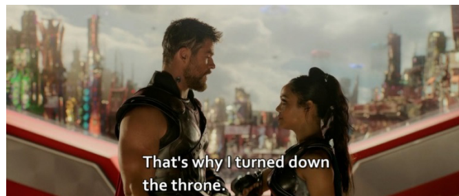
Gambar 2 Thor menyakinkan Valkyrie untuk menyelamatkan Asgard .

Thor juga mempunyai kelebihan dari sifatnya yang memperhatikan orang-orang di sekitarnya, terutama rakyatnya, Asgardian . Hal ini bisa terlihat dari potongan adegan berikut beserta kutipan dialognya.